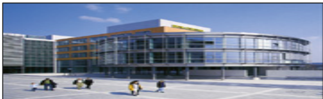
ProDevFi Funktionen (Auszug):

„Die SAP basierte Lösung für Projekt- und Development-Finanzierungen“